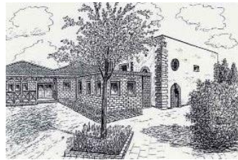
Dat es Heimat

Wilfried-Hatzfeld-Str. 2 info@bv-vilich-mueldorf.de